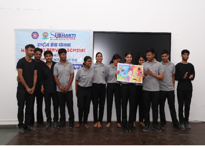
सेवा योजना (NSS) इकाई द्वारा 27 अप्रैल 2026 को लालितादित्य किया गया। कार्यक्रम का उद्देश्य विद्यार्थियों को नशे के दुष्प्रभावों