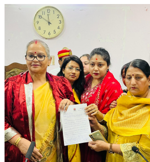
स्थित त्रिलोकनाथ समागार में प्रातः 11 बजे प्रारम्भ हुई इस बैठक में पार्षदों, अधिकारियों तथा कर्मचारियों की उपस्थिति रही।

वह किसी भी मां का अपमान करने की कल्पना भी नहीं कर सकती। उन्होंने आरोप लगाया कि लंबे समय तक महिलाओं को उनके अधिकारों से वंचित रखा गया तथा महिलाओं से जुड़े महत्वपूर्ण विषयों पर विरोध। कर उनके सम्मान को ठेस पहुंचाई गई। उन्होंने कहा कि अब देश की नारी जागरूक हो चुकी है और अपने अधिकारों तथा सम्मान की रक्षा के लिए पूरी दृढ़ता के साथ खड़ी है। महापौर ने बुधवार को उनके आवास पर हुए प्रदर्शन का उल्लेख करते हुए कहा कि उनकी नामपट्टिका पर जूता चलाना न केवल उनके पद का, बल्कि पूरे शहर की गरिमा का अपमान है। उन्होंने इसे लखनऊ की प्रथम नागरिक तथा एक सैनिक परिवार की महिला के सम्मान पर आघात बताया।