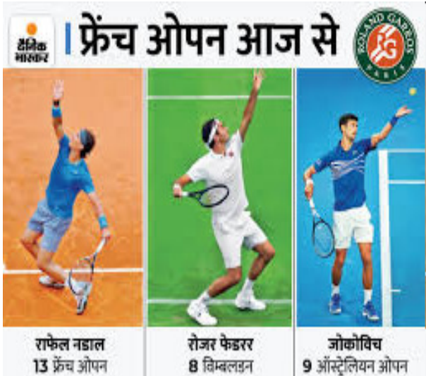
फ्रेंच ओपन आज से राफेल नडाल 13 फ्रेंच ओपन रोजर फेडरर 8 विंबल्डन नोवोकोविच 9 ऑस्ट्रेलियन ओपन

मेलबर्न, 14 जनवरी। चौथी वरीयता प्राप्त टेलर फ्रिंज ने मंगलवार को जेनसन ब्रुकसबी पर 6-2, 6-0, 6-3 से जीत के साथ लगातार सातवें साल ऑस्ट्रेलियाई ओपन के दूसरे दौर में