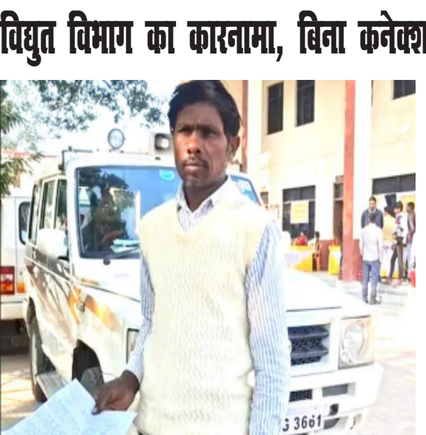
फतेहपुर-बाराबंकी। विद्युत उपखंड क्षेत्र में बिजली विभाग का एक अजब-गजब करनामा सामने निकलकर आया है। बिना बिजली