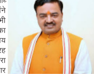
मनरेगा-सामग्री मद में 1240.90 करोड़ धनराशि जिलों को की जा रही है अवमुक्त संवाददाता। लखनऊ। महात्मा गांधी राष्ट्रीय रोजगार गारंटी योजना (मनरेगा) के अंतर्गत निर्माण सामग्री आपूर्तिकर्ताधेजेंसियों व कुशलअर्ध कुशल श्रमिकों के लिए त्योहारों से पहले एक अच्छी खबर है। इन लोगों के बकायें का जल्द ही भुगतान होगा। उप मुख्यमंत्री केशव प्रसाद मौर्य के निर्देश पर इस हेतु 1240.90 करोड़ की धनराशि स्टेट से जिलों को भेजी जा रही है। उप मुख्यमंत्री ने सभी सम्बन्धित अधिकारियों को निर्देश दिए हैं कि निर्धारित प्रक्रिया के अनुसार नियमानुसार इसका व्यवधेयों का भुगतान सुनिश्चित किया जाए। उप मुख्यमंत्री केशव प्रसाद मौर्य ने कहा है कि प्रदेश सरकार श्रमिकों के साथ-साथ निर्माण सामग्री आपूर्तिकर्ता फर्मों के हितों की रक्षा के लिए भी लगातार काम कर रही है। श्रमिकों की मजदूरी हो या निर्माण सामग्री आपूर्तिकर्ता एजेंसी सभी भी योजनांतर्गत ससमय भुगतान किया जाए, यह सुनिश्चित करने हेतु अधिकारियों को निर्देश दिये गये हैं। राजस्व स्तर से जनपदों को धनराशि निर्गत करने की कार्यवाही भी शुरू की जा चुकी है। जल्द ही निर्माण सामग्री आपूर्तिकर्ता एजेंसियों के बकायें का भुगतान किया जाएगा। यह धनराशि 15,16,17 एवं 18 अक्टूबर को जनपदों को अवमुक्त की जाएगी, जिसकी कार्यवाही शुरू भी जा चुकी है। विदिनांक 15 अक्टूबर 2024 को करीब 15 जनपदों (निर्धारित रोस्टर के हिसाब से) के खातों में सामग्री मद हेतु धनराशि अवमुक्त की गई। प्रत्येक जनपद हेतु धनराशि के आहरण के लिए तिथि एवं समय का निर्धारण कर तालिका की साझा की गई है। पत्र जारी कर बताया गया कि उक्त व्यवस्था में बिना किसी तकनीकी समस्या के निर्धारित समयवधि में जनपद तालिका के अनुसार निर्धारित धनराशि का आहरण कर सकेंगे। समस्त कार्यक्रम अधिकारियों को धनराशि आहरण हेतु निर्धारित तिथि एवं समय पर उपलब्ध रहने के निर्देश दिये गये हैं। पत्र द्वारा यह भी बताया गया कि इस धनराशि से कुशल, अर्धकुशल एवं सामग्री मद का भुगतान किया जा सकता है।