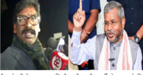
है। दो सीटों पर असहमति है, जिसे दोनों पार्टियां जल्द ही सुलझा लेने की संभावना है। भगवा पार्टी को सबसे बड़ी चुनौती एजेएसयूपी से मिलने की संभावना है, जिसकी एक विशाल क्षेत्र में बड़ी उपस्थिति है, जिसमें ज्यादातर आदिवासी बहुल निर्वाचन क्षेत्र हैं। मीडिया रिपोर्ट्स की मानें तो पार्टी ने 16 सीटों की मांग की है जबकि भगवा पार्टी 10-11 सीटें छोड़ने को

एजेंसी। झारखंड हाल ही में संपन्न विधानसभा चुनावों में हरियाणा में अप्रत्याशित सफलता से उत्साहित भगवा पार्टी ने अपने लिए मानक ऊंचा कर लिया है और सौहार्दपूर्ण समाधान की संभावना को बाधित किए बिना, अधिक से अधिक सीटें हासिल करने के लिए प्रतिबद्ध है। भाजपा यहां अपनी पूरी ताकत लगा रही है। झारखंड में विधानसभा चुनावों में हरियाणा में अप्रत्याशित सफलता से उत्साहित भगवा पार्टी ने अपने लिए मानक ऊंचा कर लिया है और सौहार्दपूर्ण समाधान की संभावना को बाधित किए बिना, अधिक से अधिक सीटें हासिल करने के लिए प्रतिबद्ध है। भाजपा यहां अपनी पूरी ताकत लगा रही है। साथ ही साथ सहयोगियों को भी साथ लेकर चलने की कोशिश है। इससे पहले, भगवा पार्टी ने एनडीए के अन्य सहयोगियों के लिए केवल 12 सीटें छोड़ने की योजना बनाई थी, हालांकि, उसने समायोजन करने का फैसला किया है। नीतीश कुमार की अगुवाई वाली जेडीयू 4 सीटों के लिए दबाव बना रही है, जबकि बीजेपी पार्टी के लिए 2 सीटें छोड़ना चाहती