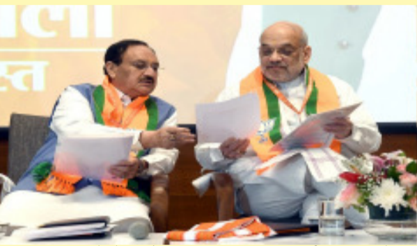
संगठन चुनाव को लेकर तैयारियां तेज हो गई हैं। दरअसल, भाजपा राष्ट्रीय स्तर पर संगठन का चुनाव कराने जा रही है। इसी के तहत राष्ट्रीय अध्यक्ष का भी चुनाव होगा। आपको बता दें कि वर्तमान में पार्टी अध्यक्ष जेपी

एजेंसी। नई दिल्ली यही कारण है कि भाजपा ने संगठन के चुनाव कराने के लिए अधिकारियों की घोषणा कर दी है। इसके लिए बकायदा भाजपा की ओर से प्रेस रिलीज जारी किया गया है। भाजपा की राष्ट्रीय कार्यकारिणी के फ़ैसले के मुताबिक पार्टी अध्यक्ष जेपी नड्डा ने डॉक्टर के लक्ष्मण को राष्ट्रीय चुनाव अधिकारी की नियुक्त किया है। आज चुनाव आयोग ने झारखंड और महाराष्ट्र विधानसभा चुनाव के लिए तारीखों का ऐलान कर दिया है। दोनों ही राज्यों के नतीजे 23 नवंबर को आ जाएंगे। इन सब के बीच भाजपा में भी