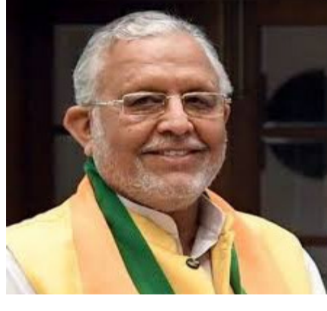
उन्होंने जीएसटी कलेक्शन पर वाणिज्य कर विभाग के अधिकारियों की प्रशंसा की। उन्होंने कहा कि दो दिन के इस अधिवेशन में विभाग के अधिकारियों द्वारा सरकार के राजस्व बढ़ाने पर विचार-विमर्श किया जाय। उन्होंने कहा कि विभाग के