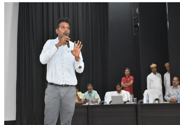
बैठ कर मिड-डे मील का भोजन ग्रहण करें इससे बच्चों में मनोबल बढ़ेगा तथा मिड-डे मील की गुणवत्ता भी ठीक होगी आज 10 ग्राम प्रधानों को अच्छे कार्य के लिए सम्मानित किया गया 217 विन्हित ग्रामों में टी.बी. रोगियों को चिन्हित कर उन्हें आवश्यक इलाज के लिए स्वास्थ्य विभाग द्वारा सरकार

उपस्थित पाये गये बताया गया कि प्रधानाध्यापक छुट्टी पर है नामांकन 35 के सापेक्ष मात्र आज मात्र 05 बच्चें उपस्थित पाये गये इस संबंध में बताया गया कि दशहरा के कारण बच्चे नहीं आए हैं सहायक अध्यापक को भविष्य के लिए सचेत करते हुए निर्देशित किया गया कि बच्चों की उपस्थिति बढ़ाने के लिए अभिभावक से वार्तालाप करें तथा नियमित रूप से ग्राम में भ्रमण करें, अन्यथा कठोर कार्यवाही किया जायेगा विद्यालय में एम.डी.एम. में रोटी तथा सोयाबीन आलू की सब्जी बनाया गया, जिसका संचलन चेक किया गया है मसाला से गुणवत्ता ठीक करने के निर्देश दिए गए रसोइए द्वारा एग्रन एवम हेड कैप का प्रयोग नहीं किया जा रहा है जिन बच्चों के अभिभावक को खाने में झेस, किताब, जूता मोजा आदि क्रय करने हेतु धनराशि प्रेषित किया गया है, ऐसे अभिभावकों को जागरूक करते हुए क्रय कराये जाने हेतु निर्देश दिया गया नियुक्त के सम्बंध में शिक्षकगण से वार्तालाप किया गया विद्यालय परिसर में पोषण वाटिका की मरम्मत करते हुए सब्जी लगाने के निर्देश दिए गए।