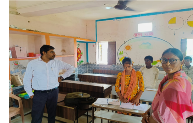
करें तथा नियमित रूप से ग्राम में भ्रमण करें, अन्यथा कठोर कार्यवाही किया जायेगा विद्यालय में एम.डी.एम. में रोटी तथा सोयाबीन आलू की सब्जी बनाया गया, जिसका संचलन चेक किया गया है मसाला से गुणवत्ता ठीक करने के निर्देश दिए गए रसोइए द्वारा एग्रन एवम हेड कैप का प्रयोग नहीं किया जा रहा है जिन बच्चों के अभिभावक को खाने में झेस, किताब, जूता मोजा आदि क्रय करने हेतु धनराशि प्रेषित किया गया है, ऐसे अभिभावकों को जागरूक करते हुए क्रय कराये जाने हेतु निर्देश दिया गया नियुक्त के सम्बंध में शिक्षकगण से वार्तालाप किया गया विद्यालय परिसर में पोषण वाटिका की मरम्मत करते हुए सब्जी लगाने के निर्देश दिए गए।

उपस्थित पाये गये बताया गया कि प्रधानाध्यापक छुट्टी पर है नामांकन 35 के सापेक्ष मात्र आज मात्र 05 बच्चें उपस्थित पाये गये इस संबंध में बताया गया कि दशहरा के कारण बच्चे नहीं आए हैं सहायक अध्यापक को भविष्य के लिए सचेत करते हुए निर्देशित किया गया कि बच्चों की उपस्थिति बढ़ाने के लिए अभिभावक से वार्तालाप करें तथा नियमित रूप से ग्राम में भ्रमण करें, अन्यथा कठोर कार्यवाही किया जायेगा विद्यालय में एम.डी.एम. में रोटी तथा सोयाबीन आलू की सब्जी बनाया गया, जिसका संचलन चेक किया गया है मसाला से गुणवत्ता ठीक करने के निर्देश दिए गए रसोइए द्वारा एग्रन एवम हेड कैप का प्रयोग नहीं किया जा रहा है जिन बच्चों के अभिभावक को खाने में झेस, किताब, जूता मोजा आदि क्रय करने हेतु धनराशि प्रेषित किया गया है, ऐसे अभिभावकों को जागरूक करते हुए क्रय कराये जाने हेतु निर्देश दिया गया नियुक्त के सम्बंध में शिक्षकगण से वार्तालाप किया गया विद्यालय परिसर में पोषण वाटिका की मरम्मत करते हुए सब्जी लगाने के निर्देश दिए गए।