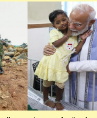
विजयन से बात की थी और उन्हें आश्वासन दिया था कि हम सहायता प्रदान करेंगे और जल्द से जल्द घटनास्थल पर पहुंचने की कोशिश करेंगे। मोदी ने आगे कहा कि NDRF,

SDRF, सेना, पुलिस, डॉक्टर, सभी ने पीड़ितों की जल्द से जल्द मदद करने की कोशिश की। मैं मृतकों के परिवारों को आश्वस्त करना चाहता हूँ कि वे अकेले नहीं हैं। उन्होंने कहा कि केंद्र सरकार केरल सरकार के साथ खड़ी है और हम यह सुनिश्चित करेंगे कि पैसे की कमी के कारण कोई भी काम बाधित न हो। उन्होंने कहा कि भूस्खलन की घटना के बारे में जब से मुझे पता चला है, तब से मैं लगातार इसकी जानकारी ले रहा हूँ। केंद्र सरकार की सभी