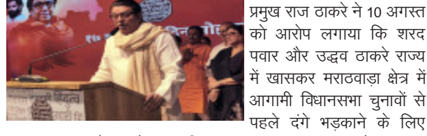
संवाददाता सम्मेलन में कहा कि उनके आंदोलन को ढाल के रूप