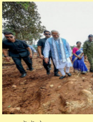
आपदाओं में से एक माना जाता है। पीड़ितों से मुलाकात के पीएम मोदी ने बड़ी बैठक भी की। इसके बाद मोदी ने कहा कि जिस दिन यह घटना हुई, उस सुबह मैंने सीएम पिनाराई

एजेंसी। नई दिल्ली प्रधानमंत्री ने कहा कि यह आपदा सामान्य नहीं है। हजारों परिवारों के सपने चकनाचूर हो गए हैं। मैंने मौके पर जाकर हालात देखे हैं। मैंने राहत शिविरों में पीड़ितों से मुलाकात की है, जिन्होंने इस आपदा का सामना किया है। मैंने अस्पताल में घायल मरीजों से भी मुलाकात की है। प्रधानमंत्री नरेंद्र मोदी ने स्थिति का आकलन करने के लिए भूस्खलन प्रभावित वायनाड का दौरा किया। 30 जुलाई को आई इस आपदा में कम से कम 226 लोगों की जान चली गई है और कई लोग अभी भी लापता हैं। इसे केवल में आई सबसे भयंकर प्राकृतिक