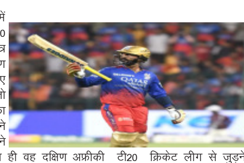
हैं क्योंकि एक या दो मौकों पर अच्छा प्रदर्शन करना आसान नहीं है। यह एक खराब श्रृंखला रही और हमें इसे स्वीकार करना होगा।" बुधवार को तीसरे वनडे में 249 रन के लक्ष्य का पीछा करते हुए 138 रन पर आउट होने के बाद कप्तान ने कहा,

दरअसल, कार्तिक दक्षिण अफ्रीका की मशहूर लीग एसए टी20 लीग में खेलेंगे। आरसीबी से संन्यास लेने के बाद दिनेश कार्तिक एसए20 में पार्ल रॉयल्स के लिए खेलेंगे। इस दौरान उन्होंने एसए20 के तीसरे सत्र के लिए अनुबंध करार पर हस्ताक्षर किए हैं। इसके साथ ही वह दक्षिण अफ्रीका की टी20 क्रिकेट लीग से जुड़ने वाले पहले भारतीय क्रिकेटर बन गए हैं। भारत के पूर्व विकेटकीपर बल्लेबाज दिनेश कार्तिक ने ऐसा कारनामा किया है जो अभी तक किसी भारतीय क्रिकेटर ने नहीं किया। दरअसल, कार्तिक दक्षिण अफ्रीका की मशहूर लीग एसए टी20 लीग में खेलते हुए दिनेश कार्तिक एसए20 में पार्ल रॉयल्स के लिए खेलेंगे। इस दौरान उन्होंने पहले भारतीय क्रिकेटर बन गए हैं। आईपीएल में लंबे समय तक खेलने वाले 39 साल के कार्तिक ने इस साल जून में क्रिकेट के सभी टूर्नामेंट से संन्यास ले लिया था और उन्हें आईपीएल टीम आरसीबी ने मेंटर सह बल्लेबाजी कोच के रूप में नियुक्त किया है।