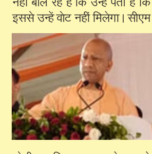
योगी आदित्यनाथ अयोध्या के मिल्कीपुर में जनसभा को संबोधित कर रहे थे उन्होंने कहा कि हम हिंदुओं को बचाने के लिए आवाज उठाते रहेंगे। मानवता की खाक के लिए आवाज उठाते रहेंगे। जब राक्षसी प्रवृत्तियां ताकतवर होंगी हमें एकजुट होना होगा। भगवान श्रीराम तो राजकुमार थे चाहते तो

संवाददाता। लखनऊ मुख्यमंत्री योगी आदित्यनाथ ने कहा कि हिंदुओं की रक्षा करना हमारा दायित्व है। आज जब बांग्लादेश में हिंदुओं पर अत्याचार हो रहा है तो सबके मुंह सिले हुए हैं। मुख्यमंत्री शनिवार को अयोध्या के मिल्कीपुर में जनसभा को संबोधित कर रहे थे। मुख्यमंत्री योगी आदित्यनाथ ने कहा कि आज बांग्लादेश में हिंदुओं पर अत्याचार हो रहा है तो सबके मुंह सिले हुए हैं कोई नहीं बोल रहा है लेकिन हिंदुओं की रक्षा करना हमारा दायित्व है। एक मानव के नाते उसकी रक्षा करना हमारा दायित्व है। उन्होंने सभी विपक्षी पार्टियों को निशाने पर लेते हुए कहा कि ये लोग हिंदुओं पर हो रहे अत्याचार पर इसलिए