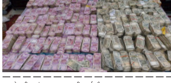
माले की जांच शुरू कर दी गई है।