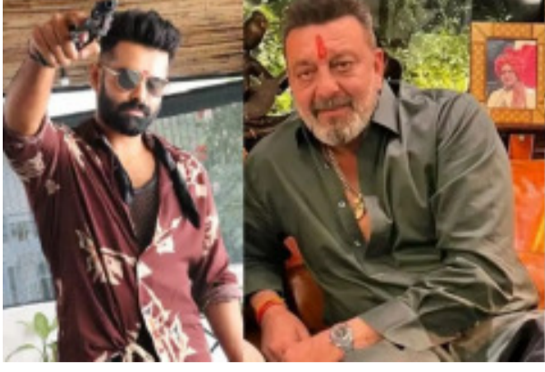
जोड़ते हैं। चार्मी और पुरी जगन्नाथ द्वारा पुरी कनेक्ट्स बैनर के तहत निर्मित यह फिल्म 15 अगस्त, 2024 को कई भाषाओं में देश भर में रिलीज होने वाली है। प्रसिद्ध मणिशर्मा द्वारा रचित गतिशील और मनोरम साउंडट्रैक एक और महत्वपूर्ण घटक है जो वास्तव में इमर्सिव सिनेमाई अनुभव का वादा करता है। डबल आईस्मार्ट निस्संदेह एक एपी फिल्म है जिसे देखने लायक है, इसकी आभाजनक कहानी, हाई-ऑक्टेन एक्शन और स्टार-स्टेड कास्ट है। 15 अगस्त, 2024 की उल्टी गिनती आधिकारिक तौर पर शुरू हो गई है।

एक सिनेमाई तूफान के लिए तैयार हो जाइए, क्योंकि राम पोथिनेनी और पुरी जगन्नाथ की धमाकेदार जोड़ी डबल आईस्मार्ट के साथ वापस आ गई है, जो एक धमाकेदार सिनेमाई अनुभव का वादा करने वाली एक हाई-ऑक्टेन एक्शन से भरपूर फिल्म है। विजाग की जीवंत पृष्ठभूमि के बीच लॉन्च किया गया ट्रेलर एक रोमांचकारी यात्रा के लिए मंच तैयार करता है। राम ने एक भव्य प्रवेश किया, खुद को डबल आईस्मार्ट के रूप में पेश किया, जो एक एक्शन से भरपूर रोमांच की शुरुआत करता है। ट्रेलर में बॉलीवुड के दिग्गज अभिनेता संजय दत्त के साथ एक आकर्षक कहानी का खुलासा किया गया है, जो किसी भी कीमत पर राम को हराने के लिए दृढ़ संकल्पित है। फिल्म की मुख्य महिला काव्या थापर ने एक ग्लैमरस एंटी की, जो अन्यथा एक्शन से भरपूर कहानी में रोमांस का एक स्पर्श जोड़ती है। ट्रेलर में हाई-ऑक्टेन एक्शन सीक्वेंस, इमोशनल अंडरटोन और भावुकता का एक सहज मिश्रण दिखाया गया है, जो एक बेहतरीन सिनेमाई अनुभव का वादा करता है। हालांकि ट्रेलर में जाने-पहचानी ट्रॉप्स हैं, लेकिन राम की करिश्माई उपस्थिति, संजय दत्त का खतरनाक चित्रण और काव्या थापर की सिजलिंग स्क्रीन प्रेजेंस दर्शकों को दुमाने के लिए निश्चित है। डबल आईस्मार्ट में बानी जे, अली, गेटअप श्रीनु, सयाजी शिंदे, मकरंद देशपांडे और टेम्पर वामसी जैसे प्रभावशाली कलाकार हैं, जो कहानी में गहराई और रहस्य