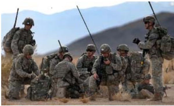
हमले के बाद लापता हो गया है।

अमेरिका की सेना ने यमन के हूती विद्रोहियों के रडार अड्डों को निशाना बनाकर हमले किए हैं। अधिकारियों ने शनिवार को बताया कि इन रडार केंद्रों का इस्तेमाल विद्रोहियों द्वारा नौवहन के लिए अहम लाल सागर गलियारे में जहाजों पर हमला करने के लिये किया जा रहा था। अमेरिका की सेना ने यमन के हूती विद्रोहियों के रडार अड्डों को निशाना बनाकर हमले किए हैं। अधिकारियों ने शनिवार को बताया कि इन रडार केंद्रों का इस्तेमाल विद्रोहियों द्वारा नौवहन के लिए अहम लाल सागर गलियारे में जहाजों पर हमला करने के लिये किया जा रहा था। यह हमला पूर्व में हूती विद्रोहियों के हमले के बाद एक वाणिज्यिक पोत के चालक दल के एक सदस्य के लापता होने के बाद किया गया है। ये हमले ऐसे समय में हुए हैं जब अमेरिकी नौसेना को हूती अभियान का मुकाबला करने के लिए द्वितीय विश्व युद्ध के बाद से अब तक के सबसे भीषण युद्ध का सामना करना पड़ रहा है। विद्रोहियों का कहना है कि ये हमले गाजा पट्टी में इजरायल-हमास युद्ध को रोकने के लिए किए गए हैं। सेना की 'सेंट्रल कमान' और से के कहा गया कि अमेरिकी हमलों ने हूती नियंत्रित क्षेत्र में सात रडार अड्डे नष्ट कर दिए हैं। हालांकि उसकी तरफ से कोई और जानकारी नहीं है।