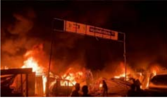
इजराइल को निशाना बनाकर राफा से दागे गए रॉकेटों की भारी बमबारी के कुछ घंटों बाद हुए। अंतर्राष्ट्रीय न्यायालय द्वारा इजराइल को राफा में अपने सैन्य आक्रमण को समाप्त करने का आदेश देने के दो दिन बाद इजरायली कार्रवाई भी हुई, जहां गाजा की आधी से अधिक आबादी ने इस महीने इजरायली घुसपैठ से पहले शरण मांगी थी। इजराइल की सेना ने अपने हमले की पुष्टि करते हुए कहा कि इसने हमास के एक प्रतिष्ठान पर

हमला किया और हमास के दो वरिष्ठ आतंकवादियों को मार गिराया। आईडीएफ ने एक्स पर पोस्ट किया उत्तर पश्चिमी राफा में सटीक हवाई हमले में यहूदिया और सामरिया में हमास चीफ ऑफ वरिष्ठ हमास अधिकारी को मार गिराया गया। इसने कहा कि वह उन रिपोर्टों की जांच कर रहा है जिनमें नागरिकों को नुकसान पहुंचाया गया है। उनके कार्यालय ने कहा कि रक्षा