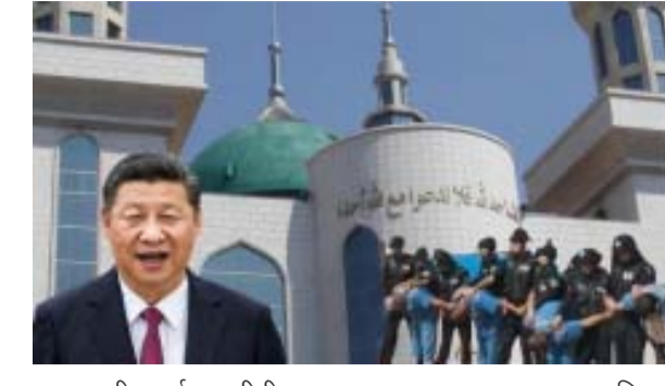
इसकी निंदा तो दूर चीन पर एक बयान नहीं दे पाए। चीन का सदाबहार दोस्त पाकिस्तान भी सबकुछ देखकर भी गूंगा बन गया। असम में जिनपिंग सरकार मुसलमानों के धार्मिक स्थलों को चाइनिज स्टाइल में बनवा रही है। इसलिए मस्जिदों को तोड़ा जा रहा है। गुंबद और मीनारों को ध्वस्त कर दिया गया है। यहां तक की मस्जिदों में दिखने वाले हरे रंग पर भी पाबंदी लगा दी गई है। पुरानी मस्जिद अरबी शैली में बनी थी जबकि नई मस्जिद में अरबी शैली की वास्तुकला खत्म कर दी गई है। दरअसल, चीन ने अपने देश में इस्लाम को भी बदल दिया है और इससे जुड़ी एक-एक चीज को भी बदल दिया है। चीन का मुसलमानों पर ऐसा हमला 57 मुस्लिम देशों के माथे पर भी जिसे देखकर पसीना आ गया है। चीन ने लगातार अपने फैसलों से कुरान, मस्जिद, इस्लामिक

चीन ने अपने देश में इस्लाम को भी बदल दिया है और इससे जुड़ी एक-एक चीज को भी बदल दिया है। चीन का मुसलमानों पर ऐसा हमला 57 मुस्लिम देशों के माथे पर भी जिसे देखकर पसीना आ गया है। चीन ने लगातार अपने फैसलों से कुरान, मस्जिद, इस्लामिक नाम, ढाढ़ी, बुर्का का चीनीकरण कर दिया है। चीन से दुनियाभर के मुस्लिमों के लिए एक बड़ी खबर सामने आई है। जिनपिंग से ऑर्डर मिलने के बाद आखिरी मस्जिद भी तोड़ दी गई है। सादियान की ग्रैंड मस्जिद चीन की सबसे बड़ी मस्जिदों में से एक है। लेकिन इस मस्जिद के तीन गुंबद पर हथौड़ा चला दिया गया। चीन ने सिर्फ एक प्रांत शिनजियांग में ही 16 हजार से अधिक मस्जिदों पर बुलडोजर चला दिया। लेकिन भारतीय मुसलमानों के नाम पर दुष्प्रचार करने वाले कुछ मुस्लिम देश