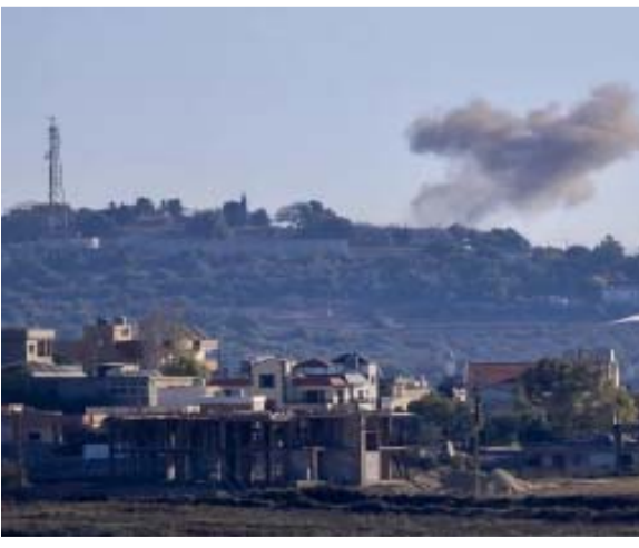
शुरुआत में इजराइल के हमले से पहले तक रफह में गाजा की आधी से ज्यादा आबादी ने शरण ली हुई थी। इलाके में हजारों लोग अब भी रह रहे हैं जबकि बहुत से लोग यहां से भाग निकले हैं। सबसे बड़े हवाई हमले की फुटेज से इलाके में भारी तबाही का मंजर दिखाई दे रहा है। इजराइली सेना ने हमले की पुष्टि की और बताया कि उसने हमास के एक ठिकाने को निशाना बनाया और इसमें हमास के दो चरमपंथी मारे गये। सेना ने बताया कि वह खबरों की जांच कर रही है कि नागरिकों को नुकसान पहुंचा है या नहीं। रक्षा मंत्री योव गैलेंट रविवार को रफह पहुंचे और उन्हें वहां तेज होते अभियान की जानकारी दी गई। फलस्तीनी रेड क्रिसेंट सोसायटी के एक प्रवक्ता ने बताया कि मृतकों की संख्या बढ़ सकती है क्योंकि रफह के तल अल सुल्तान में खोज एवं बचाव अभियान अभी जारी है। सोसायटी ने दोहराया कि इजराइल ने खुद इस इलाके को एक मानवीय क्षेत्र नामित किया था। यह इलाका उन क्षेत्रों में शामिल नहीं है, जिन्हें इजराइली सेना ने इस महीने की शुरुआत में खाली करने का आदेश दिया था।