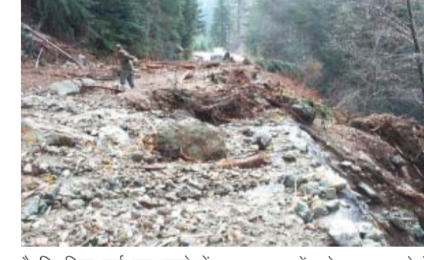
है कि जिस कई टन मलबे में सैकड़ों ग्रामीण दबे हैं, वह खतरनाक रूप से अस्थिर हो सकता है। ऑस्ट्रेलियाई रक्षा मंत्री रिचर्ड मार्ल्स ने कहा कि उनके अधिकारी शुक्रवार से पापुआ न्यू गिनी के अपने समकक्षों के साथ बात कर रहे हैं। देश की राजधानी पोर्ट मोरेस्बी से लगभग 600 किलोमीटर दूर उत्तर-पश्चिम में एंगा प्रांत में शुक्रवार को भूस्खलन हुआ था। इस

इजराइल की सेना ने अपने हमले की पुष्टि करते हुए कहा कि इसने हमास के एक प्रतिष्ठान पर हमला किया और हमास के दो वरिष्ठ आतंकवादियों को मार गिराया। आईडीएफ ने एक्स पर पोस्ट किया उत्तर पश्चिमी राफा में सटीक हवाई हमले में यहूदिया और सामरिया में हमास चीफ ऑफ वरिष्ठ हमास अधिकारी को मार गिराया गया। फिलिस्तीनी स्वास्थ्य कार्यकर्ताओं ने कहा कि दक्षिणी गाजा शहर राफा में इजरायली हमलों में कम से कम 35 लोग मारे गए, जबकि कई अन्य घायल हो गए। अधिकारियों के अनुसार, कई अन्य लोग घ घटकते मलबे में फंसे हुए थे। गाजा के स्वास्थ्य मंत्रालय के अनुसार, मृतकों में अधिकतर महिलाएं और बच्चे शामिल हैं, जबकि दर्जनों अन्य घायल हुए हैं। ये हमले रविवार (26 मई) को कई महीनों में पहली बार तेल अवीव और मध्य इजराइल को निशाना बनाकर राफा से दागे गए रॉकेटों की भारी बमबारी के कुछ घंटों बाद हुए। अंतर्राष्ट्रीय न्यायालय द्वारा इजराइल को राफा में अपने सैन्य आक्रमण को समाप्त करने का आदेश देने के दो दिन बाद इजरायली कार्रवाई भी हुई, जहां गाजा की आधी से अधिक आबादी ने इस महीने इजरायली घुसपैठ से पहले शरण मांगी थी। इजराइल की सेना ने अपने हमले की पुष्टि करते हुए कहा कि इसने हमास के एक प्रतिष्ठान पर हमला किया और हमास के दो वरिष्ठ आतंकवादियों को मार गिराया। आईडीएफ ने एक्स पर पोस्ट किया उत्तर पश्चिमी राफा में सटीक हवाई हमले में यहूदिया और सामरिया में हमास चीफ ऑफ वरिष्ठ हमास अधिकारी को मार गिराया गया। इसने कहा कि वह उन रिपोर्टों की