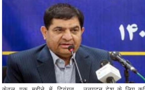
उत्पादन देश के लिए कठिन मुद्दा का एक प्रमुख स्रोत प्रति दिन 3.6 मिलियन बैरल से अधिक हो गया। तेल मंत्री जवाद ओवजी ने रविवार को कहा था कि इस्लामिक गणराज्य को निशाना बनाने वाले पश्चिमी प्रतिबंधों के बावजूद, ईरान अब प्रति दिन लगभग 2 मिलियन बैरल निर्यात कर रहा है। मोखबर

केवल एक महीने में दिवंगत इब्राहिम रायसी की जगह लेने के लिए राष्ट्रपति चुनाव की तैयारी कर रहा है। इस बीच, ईरान की नई कट्टरपंथी संसद द्वारा मंगलवार को अपना नया अध्यक्ष चुने जाने की उम्मीद है। अपनी टिप्पणी में मोखबर ने कार्यालय में रायसी के समय की प्रशंसा की, यह देखते हुए कि ईरान का कच्चे तेल का