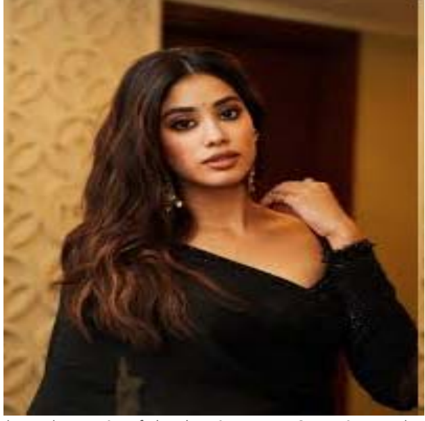
डेट आगे बढ़ा दी गई है। फैंस भी एक बार फिर स्क्रीन पर फ्रेश जोड़ी देखने के लिए बेताब हैं। वहीं, क्रिकेट प्रेमी दर्शकों भी इस फिल्म का बेसब्री से इंतजार कर रहे हैं।

जान्हवी कपूर और राजकुमार राव अभिनीत फिल्म मिस्टर एंड मिसेज माही बीते लंबे समय से अपनी रिलीज को लेकर चर्चाओं में है। शरण शर्मा द्वारा निर्देशित यह फिल्म पूर्व भारतीय क्रिकेट कप्तान महेंद्र सिंह धोनी के जीवन पर आधारित एक स्पोर्ट्स ड्रामा है। वहीं, अब फिल्म के कुछ और पोस्टर जारी किए गए हैं, जो सोशल मीडिया पर तेजी से वायरल हो रहा है। राजकुमार राव इन दिनों अपनी दो फिल्मों को लेकर सुर्खियां बटोर रहे हैं। अभिनेता की फिल्म श्रीकांत भी जल्द सिनेमाघरों में रिलीज होने जा रही है। वहीं, दूसरी ओर वह जान्हवी कपूर के साथ मिस्टर एंड मिसेज माही में भी नजर आने वाले हैं। अब हाल ही में, मेकर्स ने फिल्म के कुछ नए पोस्टर भी जारी किए हैं, जिसमें दोनों कलाकार स्टेडियम में चीयर करते हुए नजर आ रहे हैं। फैंस को फिल्म का पोस्टर काफी पसंद आ रहा है। मालूम हो कि फिल्म मिस्टर एंड मिसेज माही की घोषणा निर्माता करण जौहर ने नवंबर 2021 में की थी, और मई 2022 में इसकी शूटिंग शुरू हुई। यह फिल्म 2021 की हॉरर थ्रिलर रुही के बाद जान्हवी और राजकुमार के दूसरे सहयोग का प्रतीक है। फिल्म में अभिषेक बनर्जी, राजेश शर्मा, कुमुद मिश्रा, जरीना वहाब और पूर्णदु भट्टाचार्य भी प्रमुख भूमिकाओं में हैं। फिल्म की शूटिंग 1 मई को पूरी हो गई थी। बता दें कि फिल्म 31 मई 2024 को सिनेमाघरों में आने वाली है। पहले इसे 19 अप्रैल को रिलीज किया जाना था, लेकिन अब मेकर्स ने इसकी