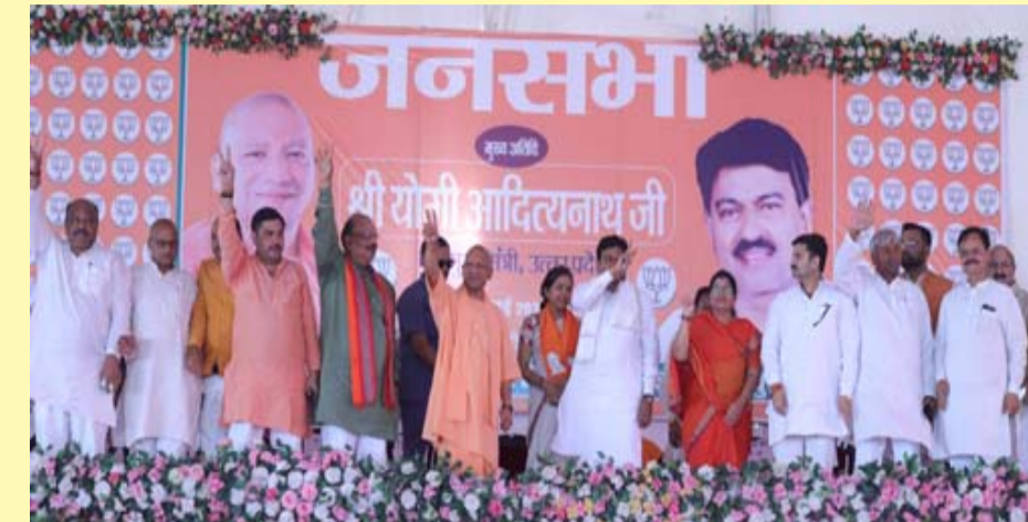
आज तो 80 करोड़ लोगों को फ्री राशन उपलब्ध कराया जा रहा है। मुख्यमंत्री योगी ने केंद्र और प्रदेश सरकार की उपलब्धियों को गिनाते हुए जनता से भाजपा के पक्ष में मतदान की अपील की। मुख्यमंत्री योगी आदित्यनाथ ने सपा पर आरोप लगाते हुए कहा कि पूर्व मुख्यमंत्री श्रद्धेय कल्याण सिंह के निधन पर सपा अध्यक्ष ने कोई संवेदना जाहिर नहीं की, जबकि एक माफिया मरा तो उसके घर फातिहा पढ़ने चले गये। उन्होंने कहा कि सपा के पास गरीबों के कल्याण के लिए कोई कार्य योजना नहीं है।

यहां सुंदर गलियारा होगा। एक एक व्यापारी को बसाने का काम होगा, किसी को उजाड़ा नहीं जाएगा। यह केवल रामभक्त ही कर पाएंगे रामद्रोही नहीं कर पाएंगे। रामद्रोही सपा सरकार के समय दंगा, कर्फ्यू होता था, व्यापारी और बेटी असुरक्षित थीं। कांग्रेस के समय में देश में घुसपैठ होती थी। आतंकवाद और नक्सलवाद सिर चढ़कर बोल रहा था, विकास का कार्य ठप था। गरीबों को मिलने वाली योजनाओं में बंदरबांट होता था।