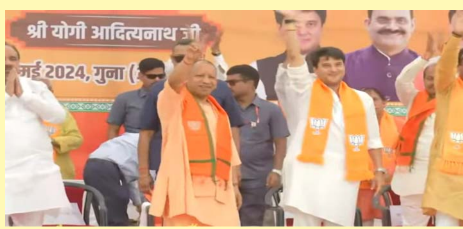
गुना में मुख्यमंत्री योगी का अंग वस्त्र और भगवान श्रीराम की प्रतिमा भेंट कर स्वागत किया। राम और कृष्ण की भूमि पर नहीं होने देगे

एजेंसी। गुना (मध्यप्रदेश), लखनऊ। मुख्यमंत्री योगी आदित्यनाथ अपने लोकसभा चुनाव प्रचार अभियान के तहत शनिवार को मध्य प्रदेश के गुना लोकसभा क्षेत्र में चुनाव प्रचार करने पहुंचे। भाजपा ने गुना से केंद्रीय मंत्री ज्योतिरादित्य सिंधिया को अपना प्रत्याशी बनाया है। मुख्यमंत्री योगी ने यहां केंद्र सरकार और सिंधिया राज परिवार की उपलब्धियां गिनाते हुए उनके लिए अधिक से अधिक संख्या में मतदान की अपील की। इस दौरान यहां उन्होंने कांग्रेस पर भी जमकर प्रहार किया। उन्होंने कांग्रेस के मैनिफेस्टो में बहुसंख्यकों की संपत्ति का सर्वे करने से लेकर