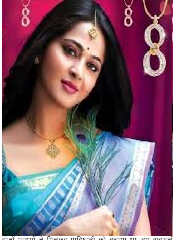
दोनों भाइयों ने मिलकर माहिष्मती को बचाया था. हम बाहुबली के प्रशंसकों के लिए इस नए अध्याय को पेश करके और इस कहानी को एनिमेटेड प्रारूप में लाकर बेहद खुश हैं.

फिल्म में प्रभास, राणा दग्गुबाती, अनुष्का शेट्टी और तमन्ना भाटिया ने अभिनय किया था. एनिमेटेड सीरीज में भी किरदार हूबहू इनके चेहरे से मिले-जुले बनाए गए हैं. हमें प्रभास और राणा दग्गुबाती की झलक देखने को मिलती है. पावर-पैक एक्शन सीरीज 17 मई 2024 से डिज्नी हॉटस्टार पर स्ट्रीम होने वाली है. बाहुबली क्राउन ऑफ ब्लड के निर्माता राजामौली ने कहा, बाहुबली की दुनिया बहुत विशाल है, और फिल्म फ्रेंचाइजी इसका सटीक परिचय थी. यह कहानी पहली बार बाहुबली और भल्लालदेव के एक काले रहस्य को उजागर करेगी क्योंकि