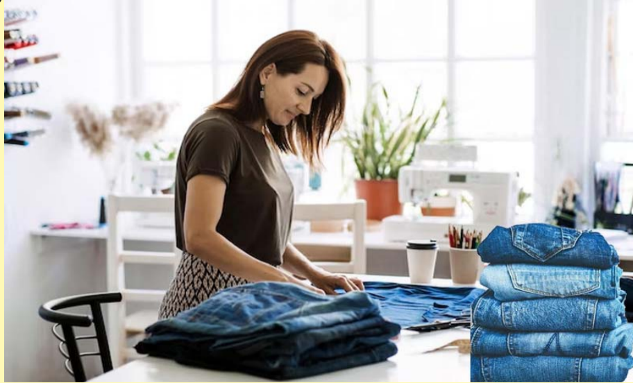
जींस की कलर पर ध्यान देना होगा अगर आपको डार्क ब्लैक जींस का कलर नया करना है तो सबसे पहले एक बर्तन में गर्म पानी डालें इसके बाद इसमें डार्ड कलर और आधा चमच नमक मिला लें। इसे अच्छी तरह से घोल लें। फिर पुरानी जींस को इस घोल में अच्छी तरह मिला लें जिससे कलर हर जगह लग जाए। जींस को घोल के अंदर

पुरानी जींस को कई बार लोग या तो फेंक देते हैं या किसी को दे देते हैं। लेकिन यह बहुत कम लोग जानते हैं कि इसे आप वापस से नए जैसी बना सकते हैं। घर में रखी हर एक चीज का हम कहीं ना कहीं किसी भी काम में इस्तेमाल कर ही लेते हैं। चाहे वह चीज कितनी भी पुरानी क्यों ना हो, हम उसे एक नया मोड़ दे देते हैं। साथ ही हमारे पहने हुए कपड़े एक समय के बाद खराब होने लगते हैं या उनका रंग उड़ जाता है। खासकर जींस बेहद जल्दी पुरानी होने लगती है। ऐसे में कुछ लोग इसे फेंक देते हैं या किसी को दे देते हैं। लेकिन क्या आप जानते हैं पुरानी जींस को भी नया किया जा सकता है? अगर नहीं तो हम आपको कुछ आसान टिप्स के बारे में बताएंगे जिन्हें फॉलो कर आप पुरानी जींस को नई जींस बना सकते हैं। ऐसे करें नया पुरानी जींस को नया बनाने के लिए सबसे पहले आपको