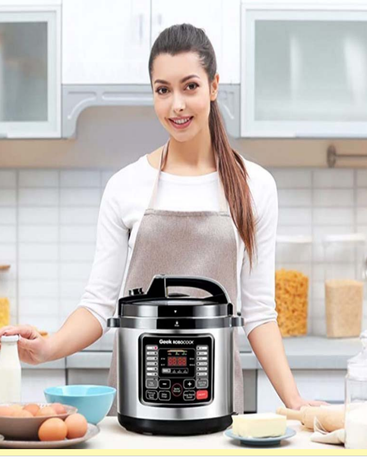
प्रेशर कुकर हमारी रसोई का एक महत्वपूर्ण हिस्सा है, जिससे खाना जल्दी और आसानी से बन जाता है। लेकिन, क्या आप जानते हैं कि प्रेशर कुकर का इस्तेमाल करने का सही तरीका क्या है? सही साइज का चुनाव अपनी जरूरत के अनुसार प्रेशर कुकर का साइज चुनें। छोटे परिवार के लिए छोटा कुकर और बड़े परिवार के लिए बड़ा कुकर उपयुक्त रहता है। कुकर की सफाई रू कुकर का इस्तेमाल करने से पहले और बाद में उसे अच्छी तरह से साफ करें। सीटी और रबर गैस्केट की सफाई पर विशेष ध्यान दें। पानी की सही मात्रा कुकर में खाना पकाते समय पानी की सही मात्रा का इस्तेमाल करें। बहुत कम या ज्यादा पानी का इस्तेमाल खाने की गुणवत्ता पर असर डाल सकता है। ढक्कन की जांच रू कुकर बंद करने से पहले ढक्कन के ठीक से बैठने की जांच करें। रबर गैस्केट को हर बार चेक करें कि वह कहीं से खराब तो नहीं है। हीट रेगुलेशन रू कुकर में खाना पकाने के बाद, गैस की आंच को मध्यम से कम कर दें। इससे खाना जलेगा नहीं और स्वादिष्ट बनेगा। प्रेशर रिलीज रू खाना पक जाने के बाद, प्रेशर को धीरे-धीरे रिलीज करें। जब रसोई सीटी खोलने से बचें, क्योंकि यह खतरनाक हो सकता है।