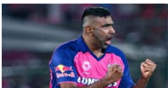
टीम सबसे नीचे हैं वहीं रॉयल्स की टीम दो जीत के साथ तीसरे नंबर पर है। अभी तक मुंबई इंडियंस की टीम ने दो मैच खेले हैं जिसमें उसे हार झेलनी पड़ी है। इस बार मुंबई अपने घर में मैच खेलेगी जिसका फायदा उसे मिलेगा और वो पहली जीत दर्ज करना चाहेगी। वहीं राजस्थान रॉयल्स ने भी अभी तक दो मैच खेले हैं जिसमें उसे दोनों में ही जीत मिली है।

आर अश्विन मुंबई के खिलाफ मैदान पर उतरते ही अपना 200वां मैच खेलेंगे। और एमएस धोनी, विराट कोहली और रोहित शर्मा जैसे दिग्गजों के ग्रुप में शामिल हो जाएंगे। इसके साथ ही अश्विन मुंबई और रॉयल्स मैच में उतरेंगे तो वे 10वें खिलाड़ी बने जाएंगे, जिन्होंने आईपीएल में 200 या इससे ज्यादा मैच खेले हैं। आईपीएल 2024 में घर पर अपने दोनों मैच जीतने वाली राजस्थान रॉयल्स टीम सोमवार यानी आज मुंबई के वानखेड़े स्टेडियम में मेजबान मुंबई इंडियंस से भिड़ेगी। इस मैच में मैदान पर उतरते ही आर अश्विन अपने नाम बड़ी उपलब्धि हासिल कर लेंगे। जिससे वो दिग्गजों के एलीट लिस्ट में शामिल हो जाएंगे। दरअसल, अंक तालिका में जहां मुंबई की