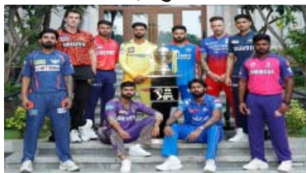
अहमदाबाद के नरेंद्र मोदी स्टेडियम में गुजरात टाइटंस और दिल्ली कैपिटल्स के बीच मुकाबला खेला जाएगा। दरअसल, क्रिकबज की रिपोर्ट के अनुसार, आईपीएल फ्रैंचाइजी के सभी दस मालिकों को निर्मंत्रण भेजा गया है। हालांकि, ये अनुमान लगाया गया है कि मालिकों के साथ उनके सीईओ और ऑपरेशनल टीमों में भी आ सकती हैं। लेकिन बैठक में अहम मुद्दों को संबोधित करने की उम्मीद है। ये कथित तौर पर केवल मालिकों के लिए है। बैठक में बीसीसीआई अध्यक्ष रोजर बिन्नी, सचिव जय शाह और

बीसीसीआई अभी से अगले सीजन की तैयारियों में जुट गया है। बीसीसीआई ने 16 अप्रैल को सभी आईपीएल टीमों के मालिकों को अहमदाबाद आने का न्योता दिया है। जहां वो सभी टीमों के मालिकों के साथ मीटिंग कर अगले सीजन की तैयारियों का खाका खींचेंगे। इस मीटिंग में कई बिन्दुओं पर चर्चा होगी है, जिसमें मेगा ऑक्शन, रिटेंशन, राइट टू मैच कार्ड और सैलरी कैप जैसे। आईपीएल का 17वां सीजन जारी है, लेकिन बीसीसीआई अभी से अगले सीजन की तैयारियों में जुट गया है। बीसीसीआई ने 16 अप्रैल को सभी आईपीएल टीमों के मालिकों को अहमदाबाद आने का न्योता दिया है। जहां वो सभी टीमों के मालिकों के साथ मीटिंग कर अगले सीजन की तैयारियों का खाका खींचेंगे। इस मीटिंग में कई बिन्दुओं पर चर्चा होगी है, जिसमें मेगा ऑक्शन, रिटेंशन, राइट टू मैच कार्ड और सैलरी कैप जैसे। जिस दिन मीटिंग होगी, उस दिन