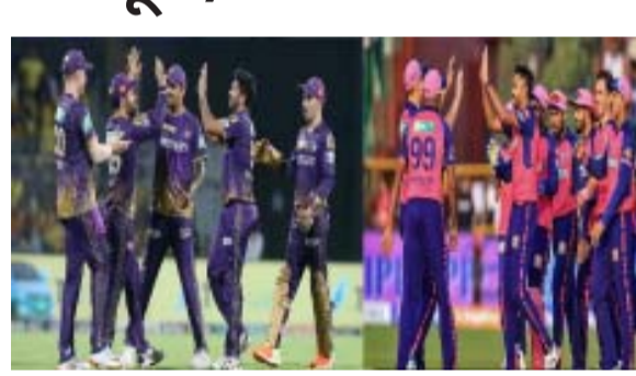
चलते इस मैच को रिशेड्यूल या रिलोकेंट किया जा सकता है। रामनवमी भारत में काफी धूम-धाम से मनाया जाता है और कोलकाता में अर्थीरिटी इस दिन सिक्वोरिटी मुद्देया कराने को लेकर थोड़ा चिंतित है। इसके अलावा साथ में देश में लोक सभा चुनाव भी चल रहे होंगे, ऐसे में सभी पहलुओं को मद्देनजर रखते हुए, बीसीसीआई इस पर जल्द फैसला ले सकता है। बीसीसीआई इस मैच को कहीं और शिफ्ट करने की बजाय किसी और तारीख पर शिफ्ट करने की प्राथमिकता दे सकता है।