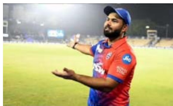
देखते हुए उनकी इस तरह की बल्लेबाजी अविश्वसनीय है।" उन्होंने कहा, "अगर आप ऋषभ पंत से प्रेरित नहीं हैं, तो फिर आप सच्चे इंसान नहीं हो। उन्हें

वर्षीय विकेटकीपर बल्लेबाज दिसंबर 2022 में कार दुर्घटना में बुरी तरह घायल हो गया था और इस बार उन्होंने आईपीएल में शानदार वापसी की। चेन्नई सुपर किंग्स के खिलाफ रविवार को उन्होंने इस सत्र का पहला अर्धशतक जमाया। अपनी इस पारी के दौरान पंत ने चार चौके और तीन छक्के लगाए। इनमें से एक छक्का उन्होंने एक हाथ के सहारे लगाया। वाटसन ने जियो सिनेमा से कहा, "यह प्रेरणादायक रहा, इसमें कोई संदेह नहीं। वह जिस तरह की परिस्थितियों से गुजरे हैं उसे