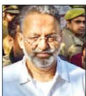
मुख्तार अंसारी की मौत की न्यायिक जांच का आदेश