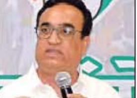
अमेरिका और युएन में उठे इस मामले के बाद शुक्रवार को कांग्रेस पार्टी ने एक बड़ा खुलासा कर दिया है। लोकसभा चुनाव से पहले दिवंगत के मुख्यमंत्री अरविंद केजरीवाल को ईडी द्वारा गिरफ्तार करना और कांग्रेस पार्टी के बैंक खाते फ्रीज करना, इस मामले को लेकर अमेरिका, जर्मनी और युएन में हिंप्णों को गई है।

एजेंसी नई दिल्ली। लोकसभा चुनाव से पहले राजनीतिक दलों को मिले चंदे को लेकर भाजपा व कांग्रेस में झगड़ना मचा है। भाजपा कह रही है कि कांग्रेस ने डोनेशन लेने के नियमों का उल्लंघन किया है, तो दूसरी तरफ कांग्रेस पार्टी का आरोप है कि चुनाव के मौके पर उसके बैंक खाते फ्रीज किए जा रहे हैं। सरकार का यह कदम देश की स्वस्थ लोकतांत्रिक प्रक्रिया के बाधित करने का प्रयास है। यह मामला अब केवल भारत तक ही सीमित नहीं रहा है, बल्कि अमेरिका और संयुक्त राष्ट्र संघ रूप से अब तक इसकी गूंज पहुंच रही है।