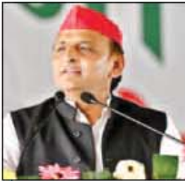
हर हलक में और हर स्थान पर किसी के जीवन को रक्षा करना सरकार का सबसे पहला दायित्व और कर्तव्य होता है। सरकारी पर निम्नलिखित हालातों में से किसी भी हालात में, किसी बंधक या कर्तव्य की प्रत्युत्पत्ति, न्यायिक प्रक्रिया से लोगों का विश्वास उठा देगा। अखिलेश यादव पूर्व मुख्यमंत्री, उत्तर प्रदेश

संवाददाता लखनऊ। समाजवादी पार्टी अध्यक्ष अखिलेश यादव ने कहा है कि भाजपा सरकार की गलत आर्थिक नीतियों के कारण महंगाई, बेरोजगारी चरम पर है। भाजपा ने आर्थिक संकट पैदा किया है। किसान, नौजवान, महिलाएं सभी परेशान हैं। भाजपा देश की सरकारी संस्थाओं का दुरुपयोग कर रही है। भाजपा सरकार में लोकतंत्र खतरे में है। संविधान विरोधी काम हो रहा है। विपक्ष की आवाज को कुचला जा रहा है। उत्तर प्रदेश सरकारी अराजकता के सबसे बुरे दौर से गुजर रहा है। युपी में कानून-व्यवस्था शून्य है। युपी में किसी का भी जीवन सुरक्षित नहीं है। अखिलेश यादव ने शुक्रवार को जारी बयान में कहा कि प्रदेश में हर दिन हत्याएं हो रही हैं। प्रदेश और देश के हालात बेहद खराब हैं। भाजपा सरकार तमाम तरह के भ्रष्टाचार में लिप्त है। इलेक्ट्रिकल डांड के नाम पर वसूली कर रही है। देश के इतिहास में पहली बार इस तरह की वसूली हो रही है। वसूली के लिए भाजपा सरकार सरकारी प्रांशुओं का प्रयोग कर रही है। जांचविभाग परीक्षाओं के पेपरलोक हो रहे हैं। भाजपा सरकार