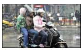
समेत कई जगह आंधी के साथ बारिश हुई। अब यह प्रभाव पूर्व की ओर बढ़ रहा है। इसकी मुख्य धारा प्रदेश के दक्षिण हिस्से की ओर है, लेकिन लखनऊ तक असर आना संभावित है। अमौसी मौसम केंद्र के अनुसार शनिवार को बादलों की आवाजाही रहेगी। हल्की बारिश, तेज हवाएं चल सकती हैं।

संवाददाता लखनऊ। पश्चिमी विक्षोभ का प्रभाव शुक्रवार से प्रदेश में दिखने लगा। मौसम विभाग के अनुसार झुका असर शनिवार को लखनऊ तक पहुंच सकता है। ऐसे में कुछ एक इलाकों में बूंदाबांदी या तेज हवा के साथ हल्की बारिश की संभावना है। अमौसी स्थित मौसम केंद्र के अनुसार ईरान के ऊपर बने दबाव के क्षेत्र से पश्चिमी विक्षोभ आने में आया। अब इससे राजस्थान के ऊपर बने उद्विग्न चक्रवाती हवा की मदद मिलने लगी है। इसकी वजह से शुक्रवार को आगरा