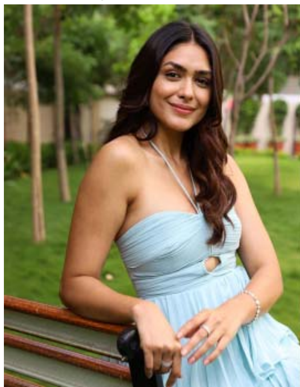
फेमिली स्टार का पहला सिंगल बहुत जल्द आ रहा है।

विजय से उसे उसके कॉलेज तक छोड़ने के लिए कहती है। वह जवाब देता है, मेरे लिए पेट्रोल खरीदो, मैं तुम्हें जरूर छोड़ दूंगा। अभी के लिए इतना ही। मृणाल ठाकुर ने सोशल मीडिया पर टीजर शेयर किया और उन्होंने लिखा, मचअवेटेड फेमिली स्टार टीजर अब रिलीज हो गया है। 5 अप्रैल को सिनेमाघरों में। फेमिली स्टार ऑन 5 अप्रैल 5 इस बीच विजय देवकोटा ने फिल्म का एक पोस्टर जारी किया और लिखा, यह 5 अप्रैल फेमिली स्टार मेरे सभी प्यारे परिवारों के लिए फेमिली स्टार टीजर है। 5 अप्रैल को आ रहा हूँ, पिछले साल दिवाली पर फेमिली स्टार के एक्टर ने अपने इंस्टाफैम को कुछ इस तरह विश किया था, हमारे परिवार की तरफ से आपके परिवार को शुभ दीपावली। इस