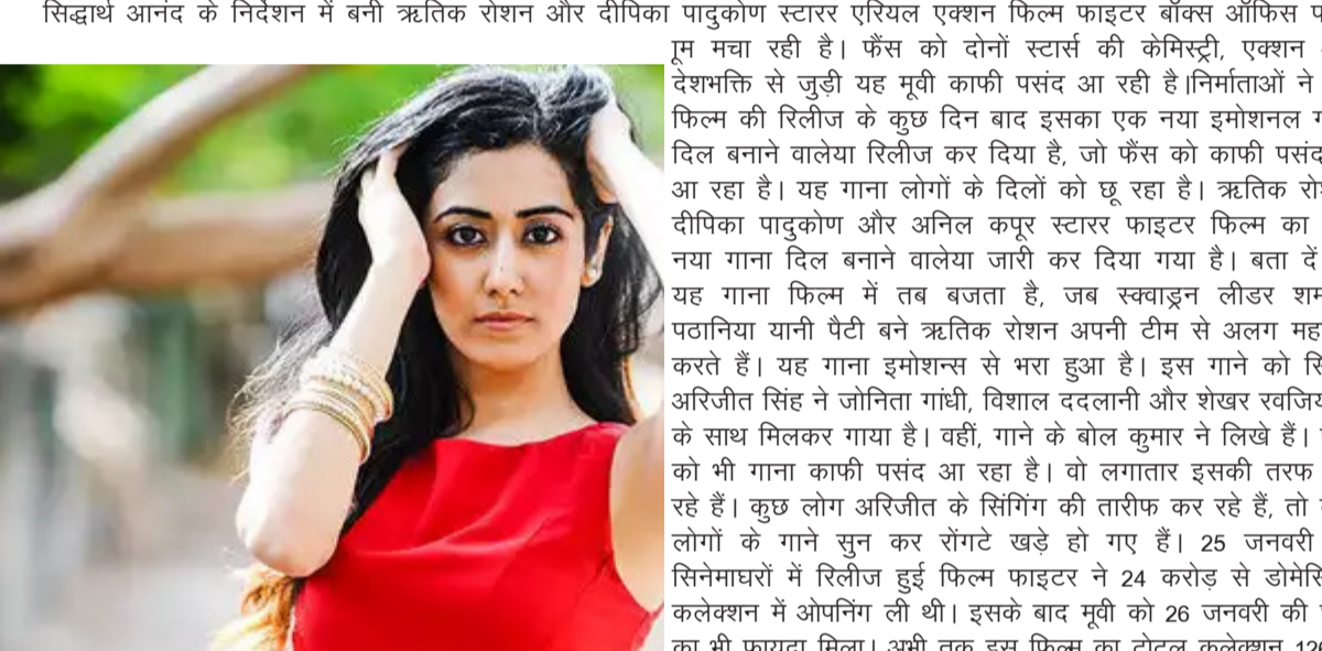
सिद्धार्थ आनंद के निर्देशन में बनी ऋतिक रोशन और दीपिका पादुकोण स्टारर एरियल एक्शन फिल्म फाइटर बॉक्स ऑफिस पर धूम मचा रही है। फैंस को दोनों स्टार्स की केमिस्ट्री, एक्शन और देशभक्ति से जुड़ी यह मूवी काफी पसंद आ रही है। निर्माताओं ने अब फिल्म की रिलीज के कुछ दिन बाद इसका एक नया इमोशनल गाना दिल बनाने वालीया रिलीज कर दिया है, जो फैंस को काफी पसंद भी आ रहा है। यह गाना लोगों के दिलों को छू रहा है। ऋतिक रोशन, दीपिका पादुकोण और अनिल कपूर स्टारर फाइटर फिल्म का एक नया गाना दिल बनाने वालीया जारी कर दिया गया है। बता दें कि यह गाना फिल्म में तब बजता है, जब स्ववाइज लीडर शमशेर पटानिया यानी पैटी बने ऋतिक रोशन अपनी टीम से अलग महसूस करते हैं। यह गाना इमोशन से भरा हुआ है। इस गाने को सिंगर अरिजीत सिंह ने जोनिता गांधी, विशाल ददलानी और शेखर विजयानी के साथ मिलकर गाया है। वहीं, गाने के बोल कुमार ने लिखे हैं। फैंस को भी गाना काफी पसंद आ रहा है। वो लगातार इसकी तरफ कर रहे हैं। कुछ लोग अरिजीत के सिंगिंग की तारीफ कर रहे हैं, तो कुछ लोगों के गाने सुन कर रोंगटे खड़े हो गए हैं। 25 जनवरी को सिनेमाघरों में रिलीज हुई फिल्म फाइटर ने 24 करोड़ से डोमेस्टिक कलेक्शन में ओपनिंग ली थी। इसके बाद मूवी को 26 जनवरी की छुट्टी का भी फायदा मिला। अभी तक इस फिल्म का टोटल कलेक्शन 126.50 करोड़ हो गया है। फाइटर में ऋतिक, दीपिका और अनिल कपूर के अलावा करण सिंह ग्रोवर और अक्षय ओबेरॉय ने भी अहम भूमिका निभाई है। 250 करोड़ रुपये की लागत से बनी फाइटर का निर्देशन सिद्धार्थ आनंद ने किया है, जिन्होंने शाह रुख खान संग पठान जैसी ब्लॉकबस्टर फिल्म बनाई थी। वहीं, इससे पहले वह ऋतिक की फिल्म वॉर और बैंग बैंग का निर्देशन भी कर चुके हैं।