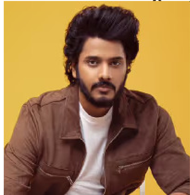
रहा है कि हनुमान बहुत जल्द कई सारे रिकार्ड्स तोड़ने और बनाने वाली है।

तहलकी मचा रखा है। जी हां, फिल्म ने अपने शानदार कलेक्शन के साथ पहला हफ्ता पूरा किया और अब इसके दूसरे हफ्ते की शुरुआत भी दमदार हुई है। तो आइए जानते हैं फिल्म ने दूसरे शनिवार घरेलू बॉक्स ऑफिस पर किरते करोड़ रुपये का विजनेस किया... रिपोर्ट के मुताबिक हनु मान ने रिलीज के 9वें दिन 14.25 करोड़ की कमाई की है। इसी के साथ हनु मान का 9 दिनों का कुल कलेक्शन अब 114.10 करोड़ रुपये हो गया है। फिल्म के आंकड़ें देखकर तो यही लग