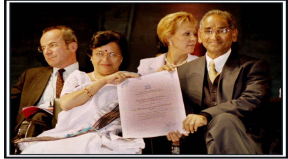
CMS Founders Receiving the UNESCO Peace Prize for Peace Education in 2002