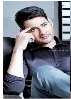
सरिलेख नीकेवरु है, हालांकि गुंदूर कारम यह आंकड़ा पार करने के काफी करीब आ गई है।

गुंदूर कारम ने इन सभी फिल्मों को पछाड़कर रिकार्ड तोड़ कमाई की है। गुंदूर कारम के प्रोडक्शन हाउस की मानें तो महेश बाबू की फिल्म ने पहले हफ्ते में वर्ल्डवाइड 212 करोड़ कमाकर रीजनल सिनेमा में भी इतिहास रच दिया है। रीजनल सिनेमा में अब तक किसी फिल्म ने इतनी तेजी से 200 करोड़ क्लब में एंट्री नहीं ली थी। इसके अलावा पहले के वर्ल्डवाइड कलेक्शन के साथ गुंदूर कारम 200 करोड़ क्लब में शामिल होने वाली महेश बाबू की दूसरी फिल्म भी बन गई है। पहले नंबर पर 214.8 करोड़ की कमाई के साथ अब भी फिल्म