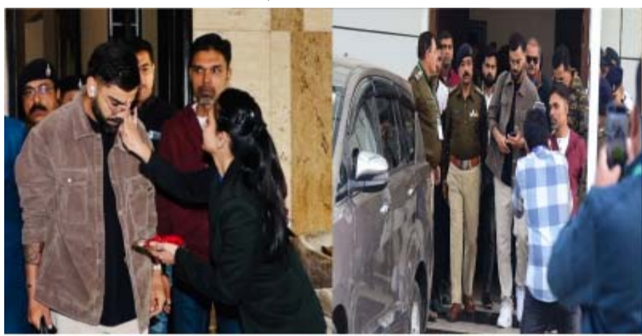
दरअसल, अफगानिस्तान के खिलाफ विराट कोहली पहले टी20 मुकाबले में नहीं खेले थे। उन्होंने व्यक्तिगत कारणों का हवाला देते हुए पहले मैच से अपना नाम वापस ले लिया था।

विराट कोहली शनिवार को इंदौर पहुंच गए हैं। जहां वो अफगानिस्तान के खिलाफ रविवार को होने वाले दूसरे टी20 मुकाबला खेलेंगे। विराट का इंदौर हवाई अड्डे पर जोरदार स्वागत हुआ। अफगानिस्तान के खिलाफ विराट कोहली पहले टी20 मुकाबले में नहीं खेले थे। भारत के स्टार बल्लेबाज विराट कोहली शनिवार को इंदौर पहुंच गए हैं। जहां वो अफगानिस्तान के खिलाफ रविवार को होने वाले दूसरे टी20 मुकाबला खेलेंगे। विराट का इंदौर हवाई अड्डे पर जोरदार स्वागत हुआ।